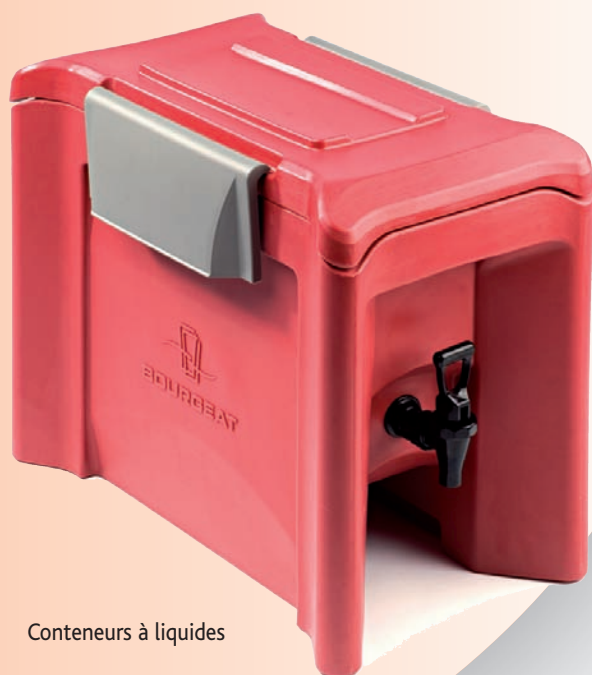
Conteneurs à liquides