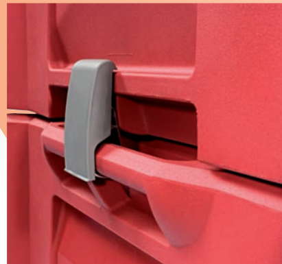
Pièce de gerbage sécurisée