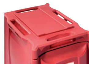
Poignées de portage

Modèles pour liquides : renforcement sous robinet pour optimisation de l'encombrement du bol lors du service.