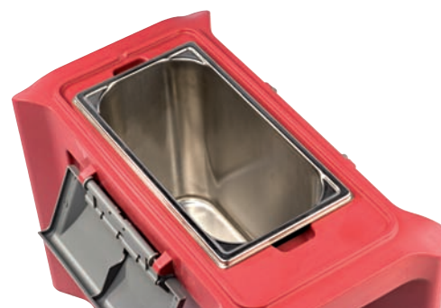
Cuve acier inoxydable